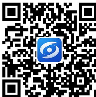
闽政通 APP 下载二维码