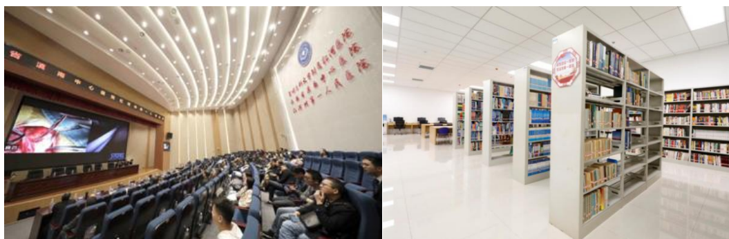
△3.0T 学术报告厅（左）图书室（右）

现有在职职工 2121 人，其中高级职称 365 人、硕士研究生 157 人，有 9 个省级临床重点专科建设项目，6 个省级医学中心分中心，州级特色专科 6 个，名医工作室 3 个，与全州 33 家医院建立战略联盟关系。