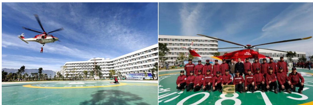
△航空紧急医学救援演练（左）红河州急救中心救援队（右）

产前诊断中心、国家住院医师规范化培训基地、红河州医学会 33 个专业委员会主任委员单位。