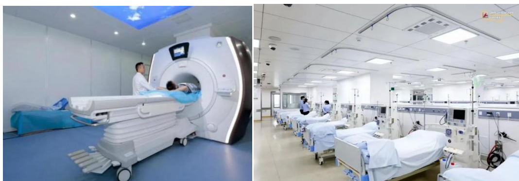
△3.0T 磁共振（左）医院血液净化中心（右）

现有在职职工 2121 人，其中高级职称 365 人、硕士研究生 157 人，有 9 个省级临床重点专科建设项目，6 个省级医学中心分中心，州级特色专科 6 个，名医工作室 3 个，与全州 33 家医院建立战略联盟关系。