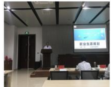
职业生涯规划大赛