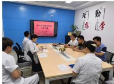
学员病例汇报大赛