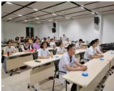
学员病历书写大赛